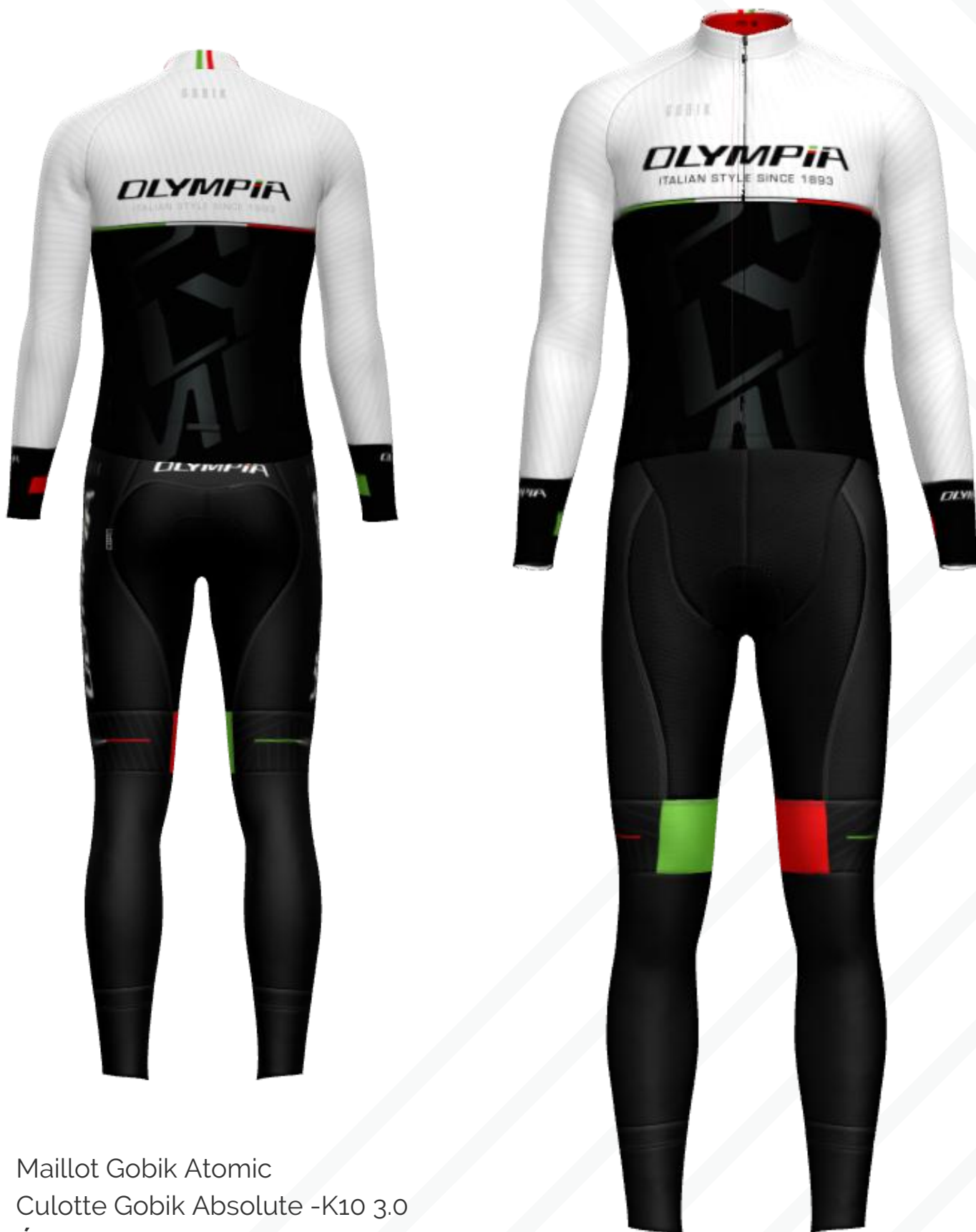
Maillot Gobik Atomic Culotte Gobik Absolute -K10 3.0 ÚLTIMAS UNIDADES EN TALLA S