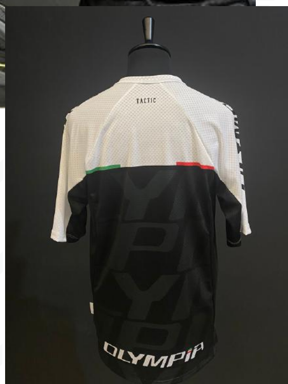
Camiseta TACTIC manga corta.